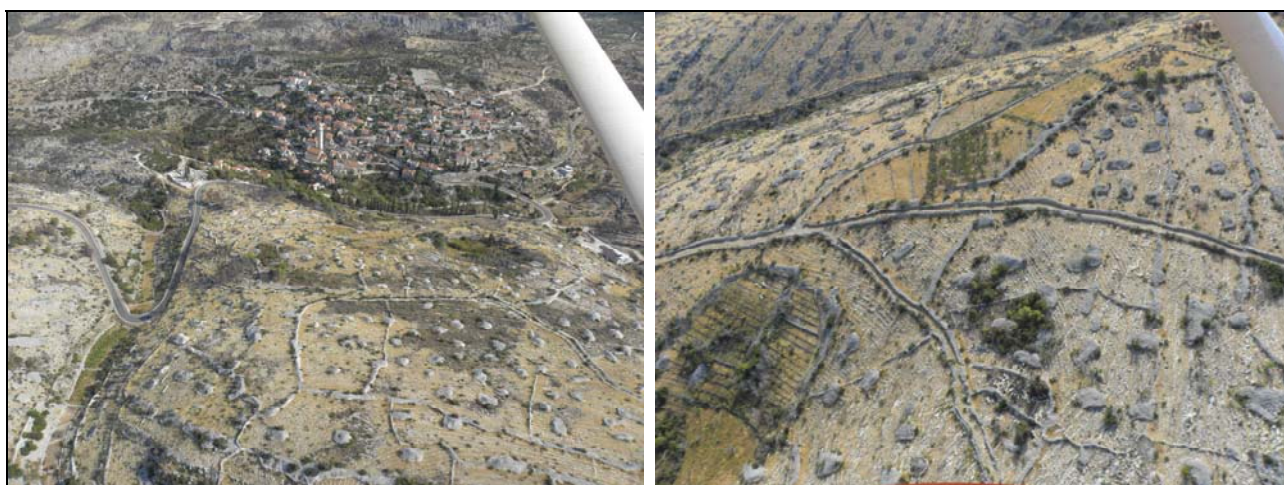
Slika 11. Pogled na dio poljskih putova u naselju Ložišća

Važniji ostali (poljski) putovi označeni su na svim kartografskim priložima ove Studije . Za sve ove putove ili njihove dijelove trebalo bi odrediti katastarske čestice (osim ako se radi o putovima u vlasništvu privatnih osoba). Isto tako treba provjeriti razloge zašto ne postoje putovi za koje postoje određene katastarske čestice.