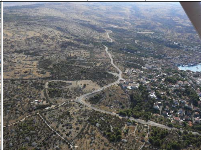
Slika 6: Državna cesta na ulazu u naselje Milna