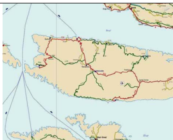
Slika 2: Razvrstane ceste na otoku Braču

Općina Milna nalazi se u Splitsko-dalmatinskoj županiji, u jugozapadnom dijelu otoka Brača (slika 1). Općina se sastoji od pet naselja i to naselja Bobovišća, Bobovišća na Moru, Ložišća, Milna i Pothume (kartogram 1). Prema mrežnoj stranici Državnog zavoda za statistiku, u vrijeme svih dosadašnjih popisa stanovništva, općina Milna obrađena je kroz tri (3) naselja, i to: Milna, Bobovišća i Ložišća. Međutim, Odlukama Općinskog vijeća iz 2014. godine ( Službeni glasnik Općine Milna , br. 7/14), naselje Milna podijeljeno je na naselje Milna i Pothume, a naselje Bobovišća na naselje Bobovišća i Bobovišća na Moru. Na taj način, općina Milna tek od 2014. g. ima pet (5) naselja. Zbog toga ne postoje službeni podaci o kretanju broja stanovnika u pet naselja, već samo u tri. Stoga je kretanje broja stanovnika u posljednjih 20 godina u Općini Milna prikazano samo za cijelo područje Općine Milna i to između tri popisa stanovništva. Brojčani podaci pokazuju nažalost blagi, ali stalni pad i to je vidljivo iz podataka u tablici 1.