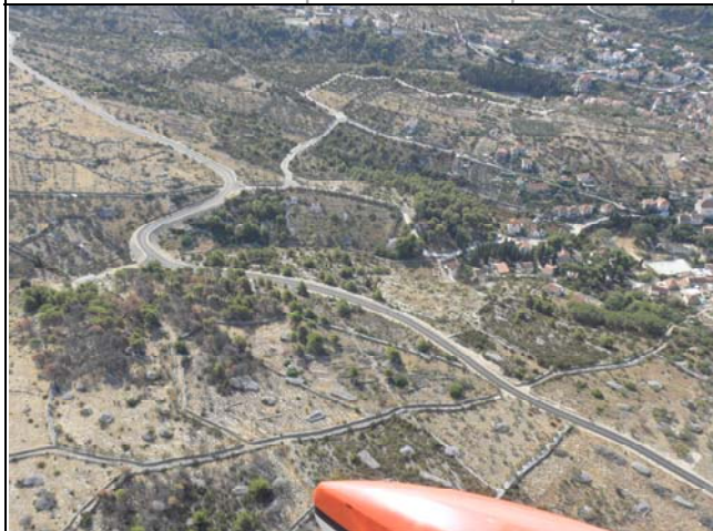
Slika 5. Državna cesta u prolazu kroz naselje Milna