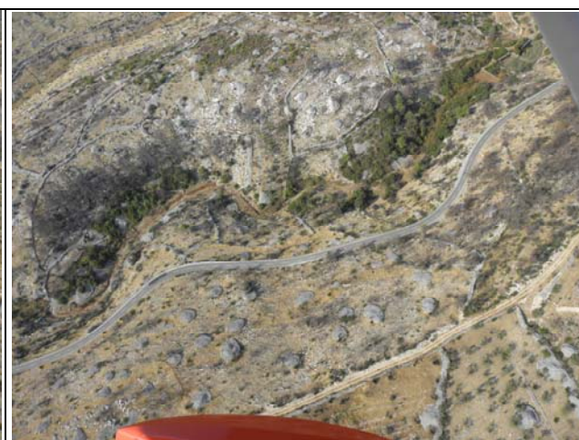
Slika 8: Županijska cesta Ž6188