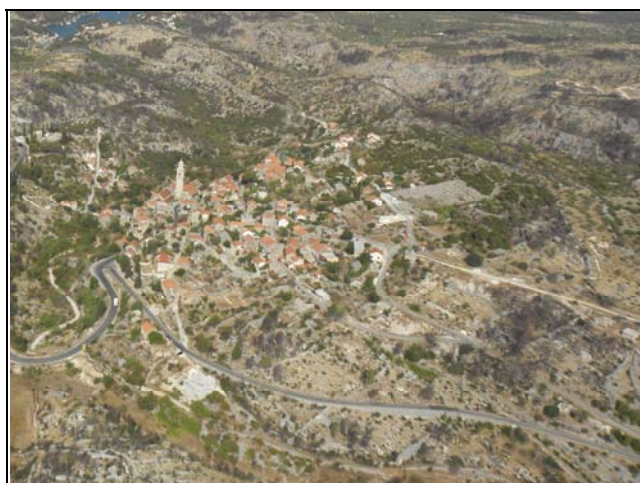
Slika 7. Spoj županijske ceste Ž6188 s državnom D114

*** na velikom dijelu trase ceste nije se mogla utvrditi katastarska čestica jer se izvedena cesta ne poklapa sa stanjem u katastru