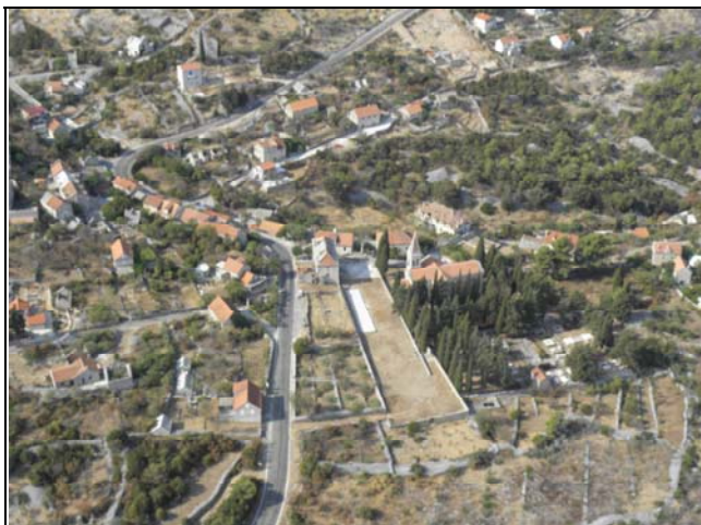
Slika 3. Državna cesta u prolazu kroz naselje Bobovišća

U pojasu državne ceste kroz veći dio naseljenog prostora Općine, osim dvije kolne trake i bankine nema izvedeno nikakvih drugih prometnih pojaseva (biciklistička staza, pješačka staza, zaustavna traka, odmorišta i sl.) (slika 3 i 4). Tom cestom odvija se dio autobusnog prometa otoka Brača, ali na području općine uz ovu državnu cestu nema ni jednog autobusnog stajališta, osim unutar građevnog područja pojedinih naselja (slika 5 i 6).