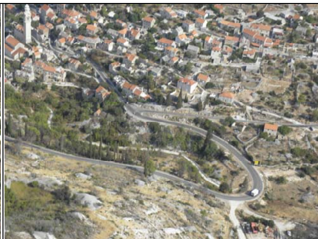
Slika 4: Državna cesta u prolazu kroz naselje Ložišća